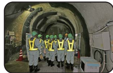
施設見学会(深度300m研究アクセス坑道)

工事現場での安全の確保のため、小学生の方は4年生以上で保護者同伴でお願いします。また入坑の際は、安全装備(つなぎ服・反射ベスト・ヘルメット・安全長靴・軍手・坑内 PHS など)を着用して頂きます。工事現場ですので、狭くて急な階段等もあります。階段の昇降等が困難な方など自立歩行に支障のある方や高所、閉所恐怖症の方などは研究坑道に入坑できない場合がありますので、事前にご確認をお願いいたします。