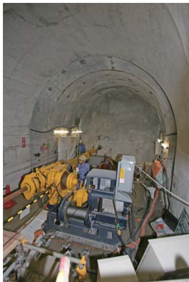
パイロットボーリング調査の様子

平成24年度には、下図に示すように3孔のパイロットボーリング調査を実施する計画であり、平成24年5月21日に深度500m研究アクセス北坑道の掘削に先立ち実施するパイロットボーリング調査（掘削長約35m）を開始しました。